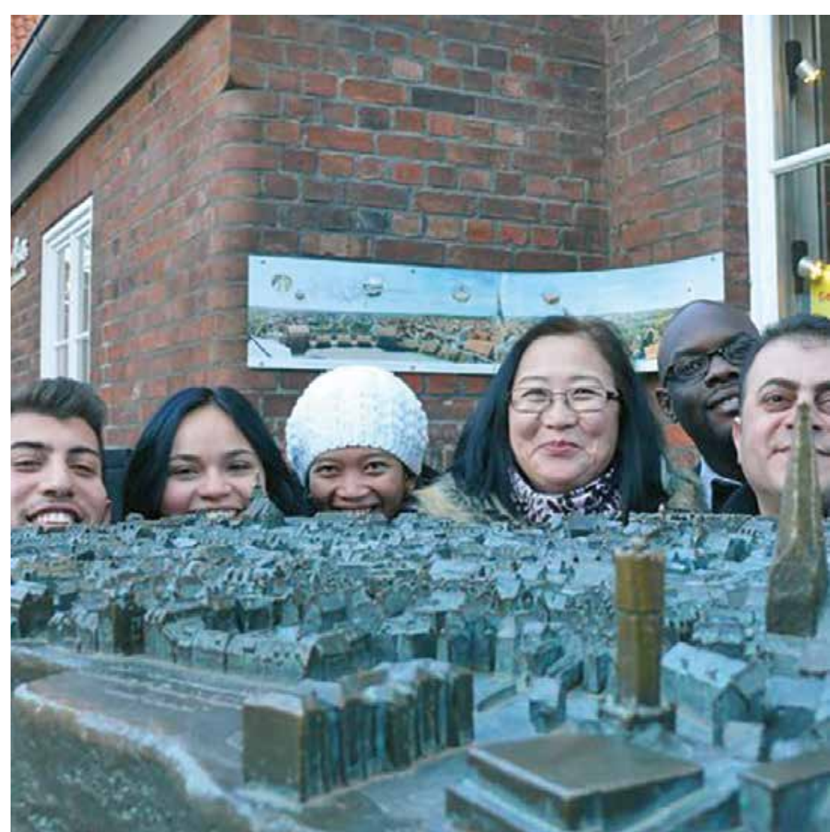
Teilnehmende des VHS mitten in der Stadt.