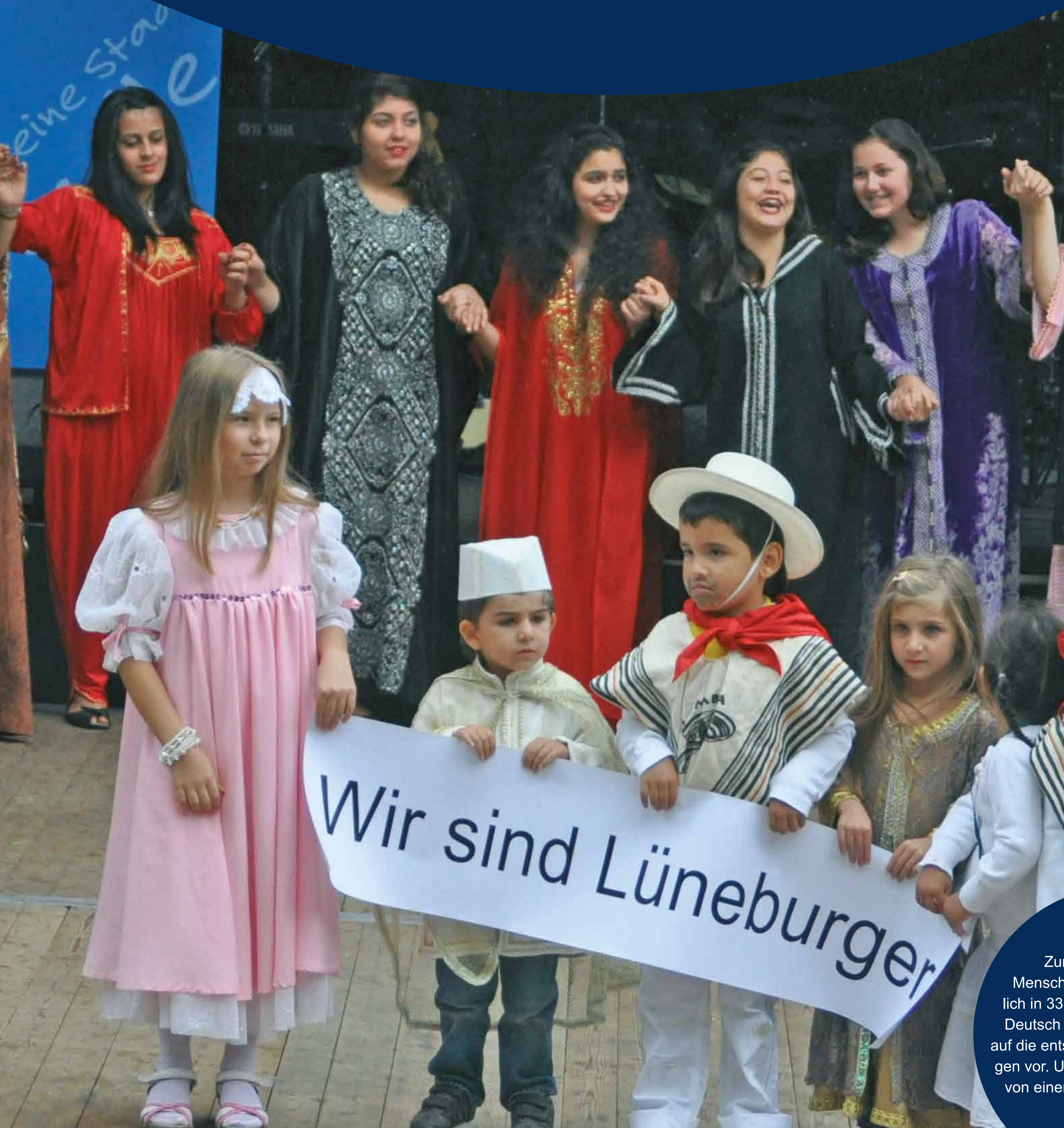
Fest der Kulturen 2011